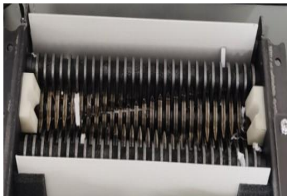
Engrenagem de corte e raspadores em metal

9. Por tratar-se de recurso administrativo com legitimidade do signatário do documento impetrado perante a Administração Municipal de Cocos, portanto a peça recursal trata-se de um documento completo, e que possui o condão de produzir efeito jurídico para a sua análise e julgamento no âmbito do processo licitatório Pregão Eletrônico n.º 031-2023.